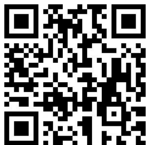
インストール用二次元コード