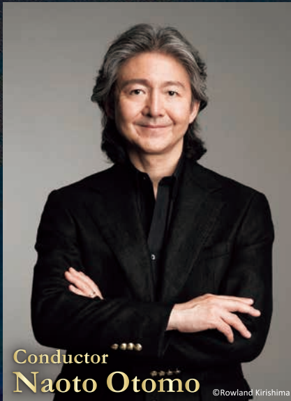
Conductor Naoto Otomo