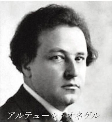
アルテュール・オネゲル