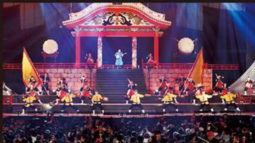
写真はイメージです。実際の演目とは異なる場合がありますので、ご了承ください。

沖縄開催38回目となる本公演も、沖縄伝統芸能と民俗芸能をベースに構成された成熟した舞台に、新たな沖縄の息吹である創作演舞が相俟って、華やかなステージを展開します。