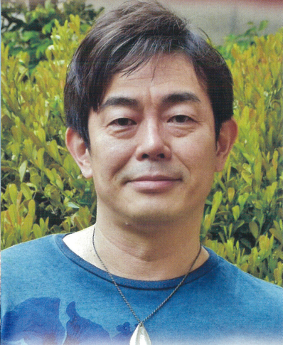
特別出演 宮沢 和史