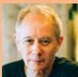
ピーター・バラカン (ブロードキャスター)