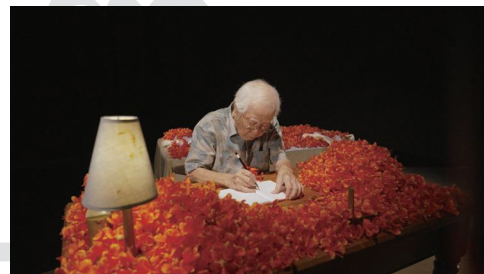
作品画像：「Recalling(s)」2025 ©Chikako Yamashiro